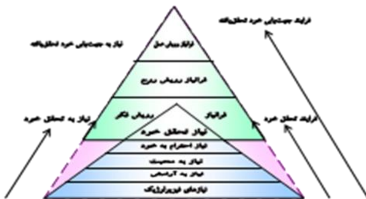
شکل ۳- هرم نیازها و فراتیاها انسانی

با مروری بر آموزه‌های اهل بیت(ع)، می‌توان گفت ادعیه و نیایش‌های اهل بیت(ع) ژرف‌ترین جست‌وجوی زیستی آدمیان است. دستیابی به رشد و کمال، درونی‌ترین لایه تحلیلی نیایش‌های بشری است. خواهانی‌های اهل بیت(ع) سامانه‌ای جامع از فرآینگیزه‌ها است.