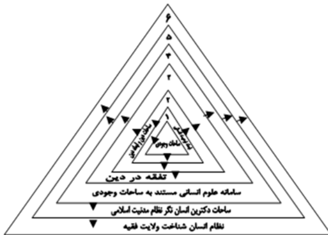
شکل شماره ۴: سطوح ساحت مرتب بر ساحت وجودی انسان و نظریه پردازی معطوف به آن